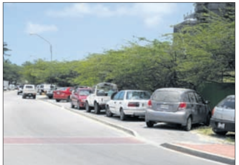
Cantidad di auto staciona den e sector aki.

edificio cu consecuencia cu e garna ta plama den aire. Ademas, ora cu caba cu cierto trabou riba e diferente pisonan, enbez cu ta uza un 'stofzuiger' e trahadonan ta djis bari y tira e resto di sushi abou, sin tene cuenta cu e biento ta plama e stof di cement riba beach. Ningun hende a spera cu durante construccion cu nada lo ta afecta, pero en todo caso no a spera e falta di consideracion completo un area ya congestion, yena cu turista y cu por duna no solamente Ritz Carlton, pero tambe Aruba un mal number, tanto esteticamente como na nivel di ecologia. □